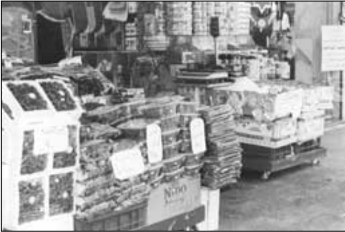
■ السلع الغذائية الأكثر تضررا من القرارات الضريبية

المأكولات الراقية ٥٢٪ والمقصف «البوفيه» ٤٢٪ والكافتيريا ٤٢٪، قال السيد فيصل القاضي نائب نقيب اصحاب المطاعم والطلويات ان تحديد نسبة الارباح الصافية للمطاعم التي لا تمسك حسابات نظامية بشكل تخميني فيه ظلم كبير مؤكداً ان المطاعم لا يمكن ان تحقق مثل تلك النسب من الارباح الصافية، موضحاً ان تعليمات دائرة الضريبة لم تأخذ بعين الاعتبار التغيرات التي تحدث في اسعار